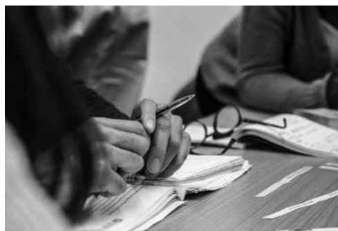
Zweimal in der Woche üben die Teilnehmenden wie aus Buchstaben Wörter werden